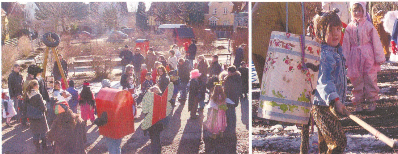
Fotos fra forrige års fastelavn på Steins Plads.

Der er som sædvanlig uddeling af fastelavnsboller og kakao, men fortrinsvis til børnene i "Lyset".